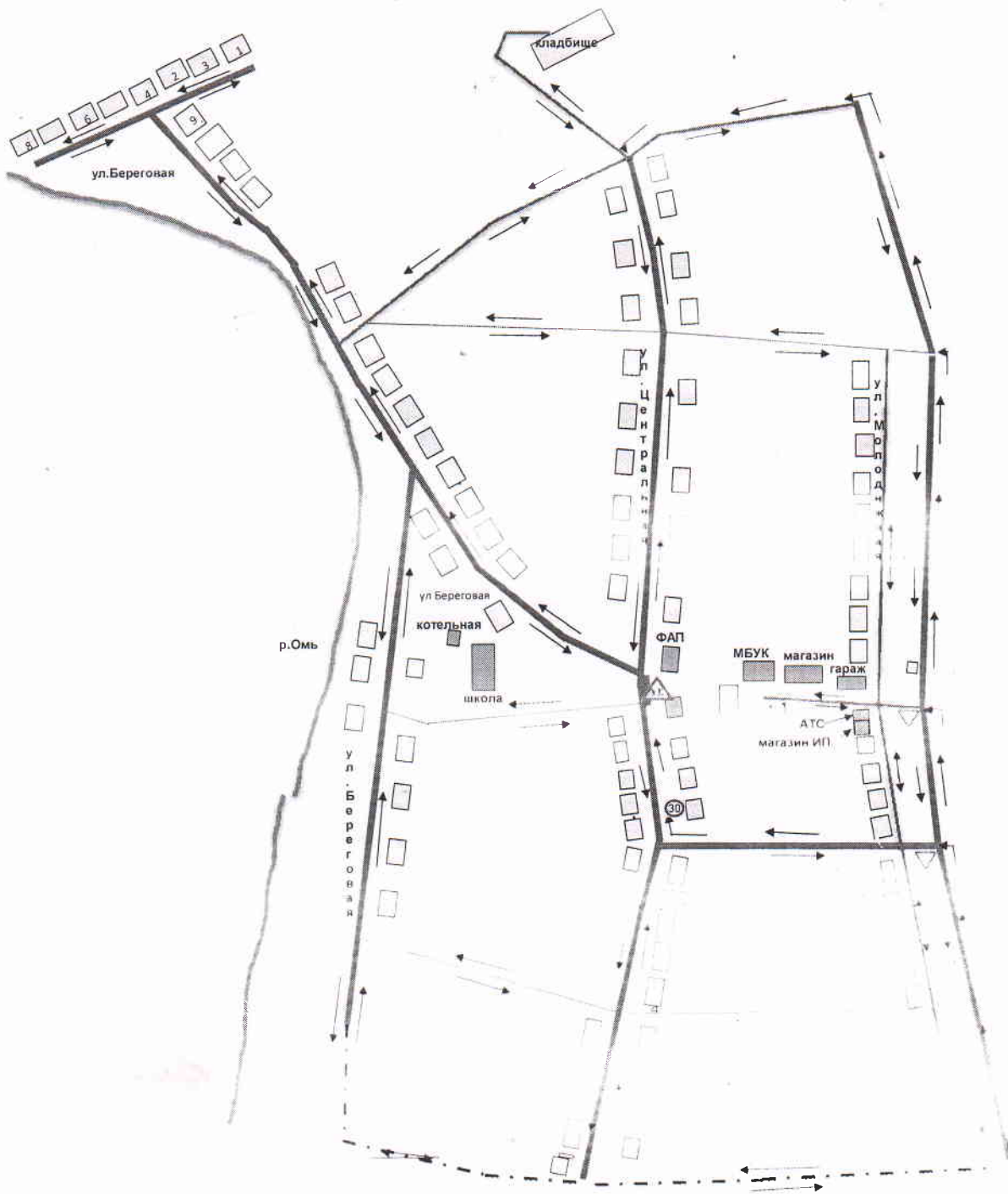
Схема размещения нестационарных объектов торговли с. Красноярка.